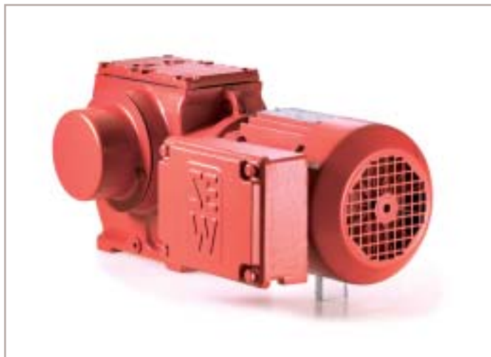
38 Afbeelding 1. SEW-wormwielreductor.

Op 1 juli aanstaande wordt de EG-richtlijn 94/9/EG, ook wel ATEX 95 en voorheen ATEX 100a genoemd, van kracht. Veel gebruikers, maar ook fabrikanten zijn zich nog steeds niet bewust van de consequenties die deze richtlijn voor ze heeft. Daarom in dit artikel een overzicht van de eisen en de daaruit voortvloeiende maatregelen, waarmee gebruikers en fabrikanten binnen de mechanische aandrijftechniek zich binnenkort geconfronteerd zien.