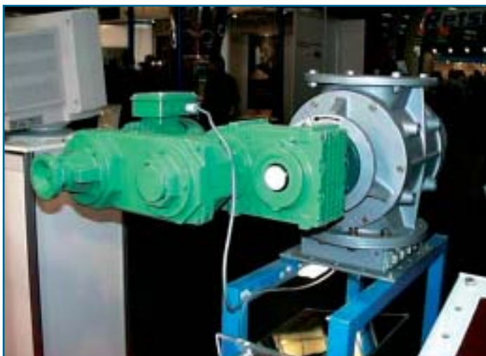
Afbeelding 4. Variatoren voor gebruik in een doseersysteem.

materiaal niet aan de voorgescreven warmte-, koude- en stootbestendigheid. Maar een aanpassing van het materiaal is niet voldoende. In een stofomgeving moet ook op andere zaken worden gelet. Als de bescherming een onvoldoende