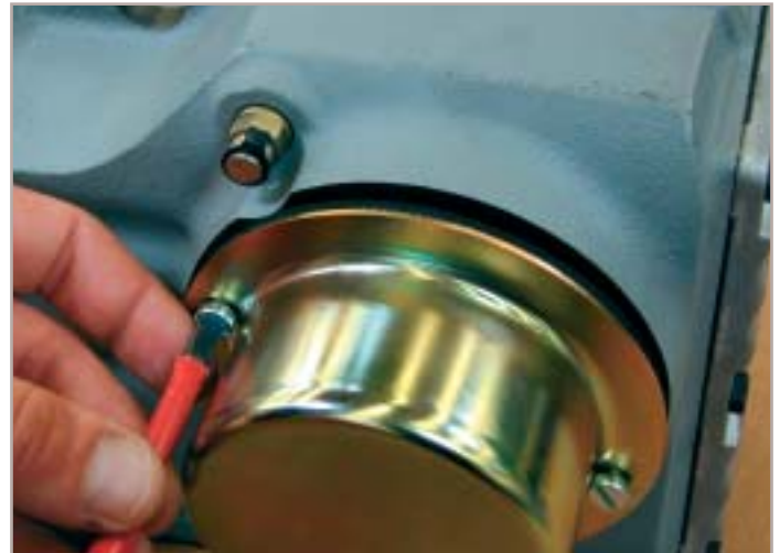
Afbeelding 3. Afgedichte, vaststaande beschermkap voor krimpschijven.

zich dat met de ATEX-richtlijn explosiebeveiliging niet opnieuw is uitgevonden, maar als gevolg van 'nieuwe en preciezere' definities zullen wel de productkenmerken veranderen.