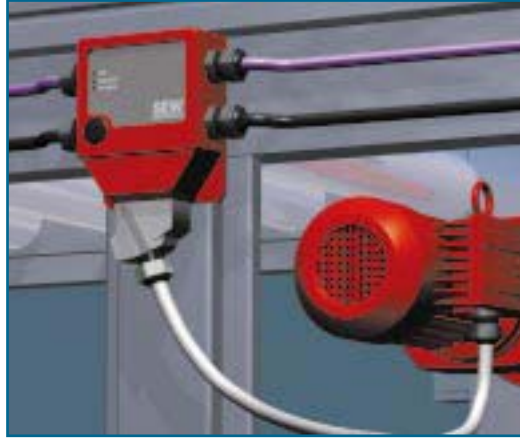
Figuur 4. MOVIMOT®-regelaar via voorgeconfectioneerde hybride kabel verbonden met SEW-veldverdelers.