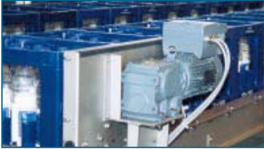
Figuur 3. SEW-MOVIMOT®-motorreductor gemonteerd op een transportband.

frequentieregelaar maakt netwerkaandrijvingen met twee draairichtingen, eenvoudige positionering met twee toerentallen, versnelling en vertraging naar keuze en continue toerentalwijzigingen mogelijk.